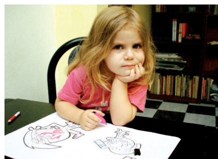
La nena observa atentamente